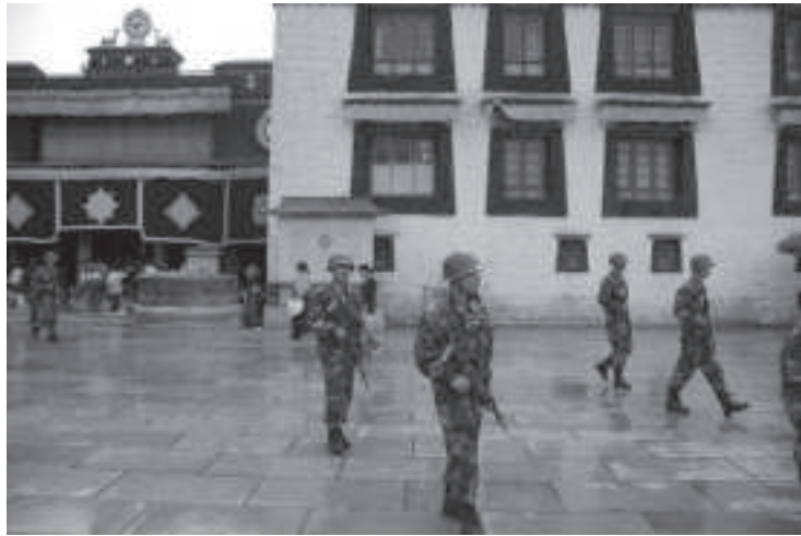
སྐྱ་སའི་གཙུག་ལག་ཁང་མདུན་དུ་དྲག་ཆས་ཉེན་རྟོག་དམག་མིས་དམ་དྲག་བྱེད་བཞིན་པ།